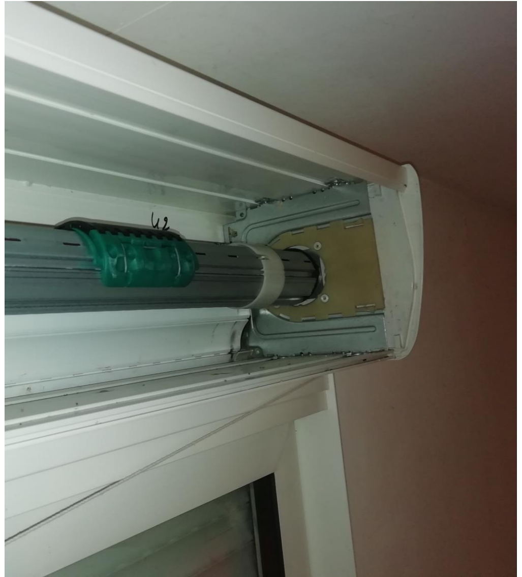
Côté moteur sans volet