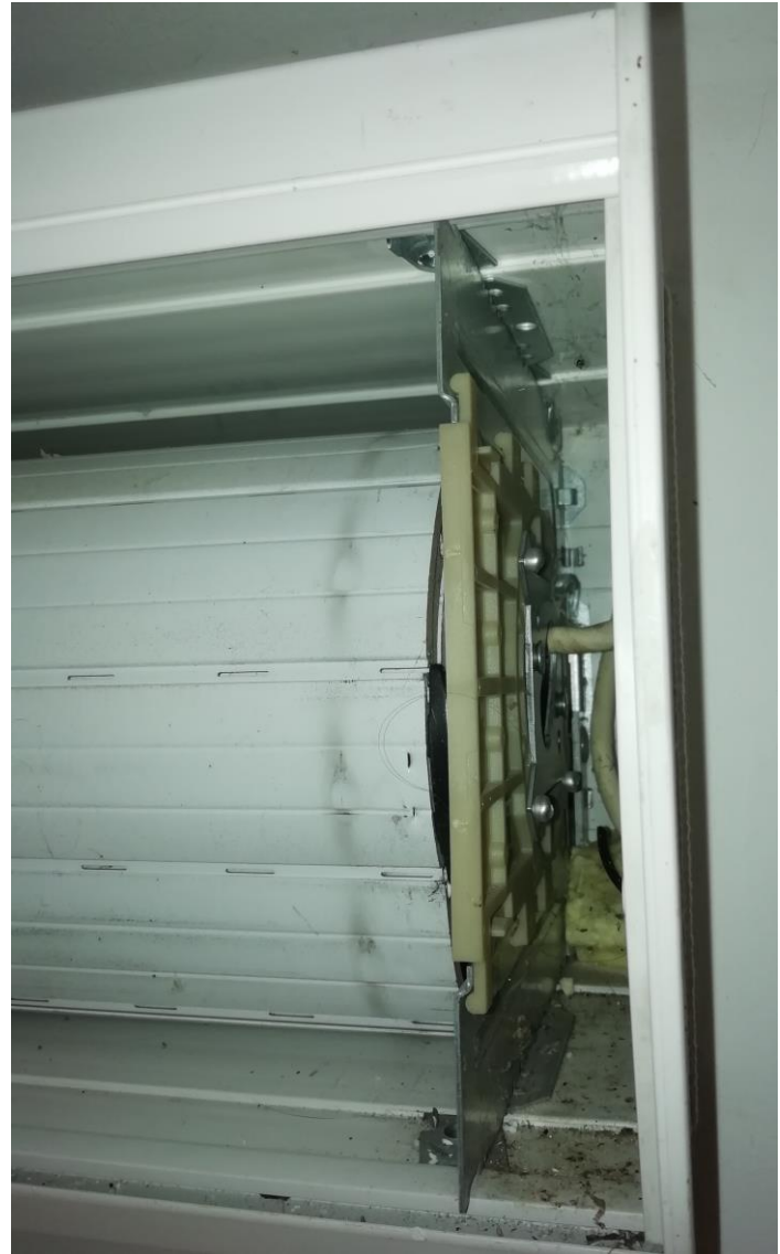
Côté moteur avec volet enroulé