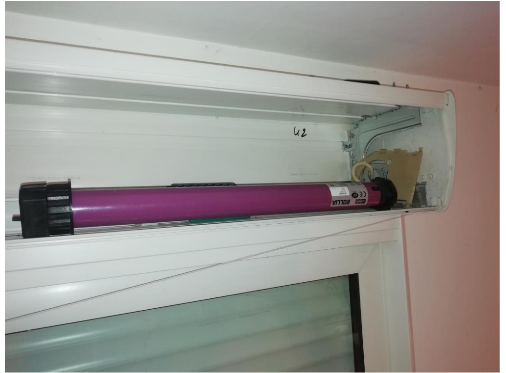
Vue du moteur actuel Marque Rollia RL5020F