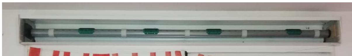
Dimension baie et coffre et visualisation coffre ouvert