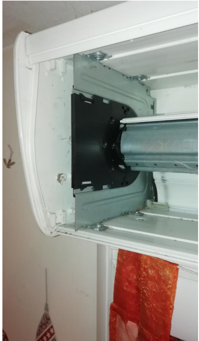
Côté sans moteur avec volet enroulé