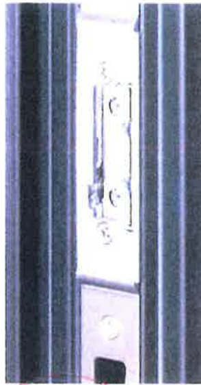
Technologie ProFix 2